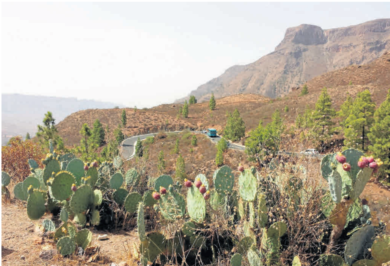
Jeden z wielu krajobrazów na wyspie Gran Canaria. Znajdziemy tu m.in. przepiękne kaktusy i drzewa iglaste