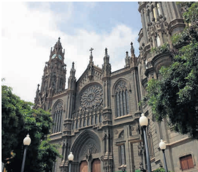
Kościół św. Jana Chrzciciela w Arucas