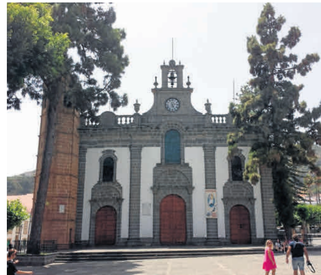
Bazylika Matki Bożej Sosnowej w Terorze