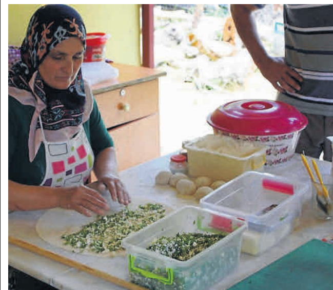
Naleśniki ze szpinakiem - tradycyjny placek gözleme