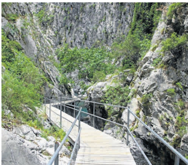
Przez Kanion Sapadere prowadzi drewniana kładka